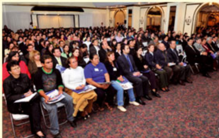
Más de setecientas personas participaron del encuentro.