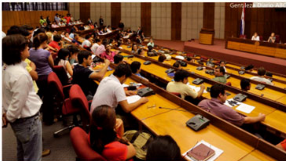
Numerosos jóvenes participaron de la reunión.

El pasado martes 20 de octubre, el rector y los decanos de la Universidad Nacional de Asunción fueron convocados a una Audiencia Pública por las comisiones de Derechos Humanos y de Cultura, Educación y Culto, que presiden las senadoras Ana Mendoza e Iris González, respectivamente, por presuntas irregularidades administrativas y denuncias de persecución reveladas por estudiantes de las facultades de Medicina, Veterinaria, Ingeniería, Filosofía y Derecho. El titular de la facultad de Derecho no asistió a la convocatoria.