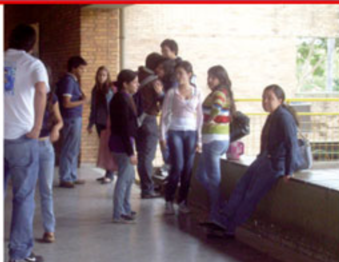
Estudiantes del nuevo plan semestral en el pasillo de la institución.

cantidad”, dijo el encargado de dirigir las cuestiones académicas de la casa de estudios más antigua de nuestro país. Esto se vuelve necesario ya que deben ir los mejores, porque “estamos formando gente que va a poner en juego tu patrimonio, entonces tenemos que formar gente que tenga la preparación necesaria. Esa es una de las exigencias de la acreditación al Mercosur”.