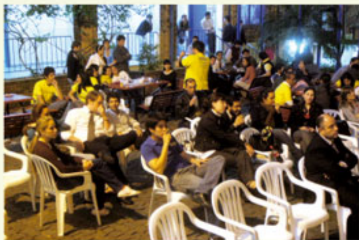
Numerosa fue la participación de los alumnos.

La “Fábrica UCA” tuvo un importante nivel participativo, y demostró que cuando se mezcla diversión, con información y conocimiento, se logran buenos resultados.