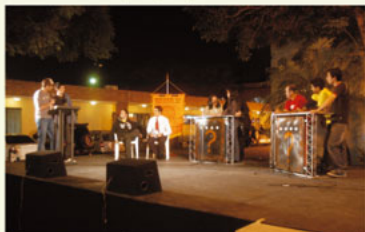
Estudiantes pusieron a prueba sus conocimientos con la Competencia del saber.