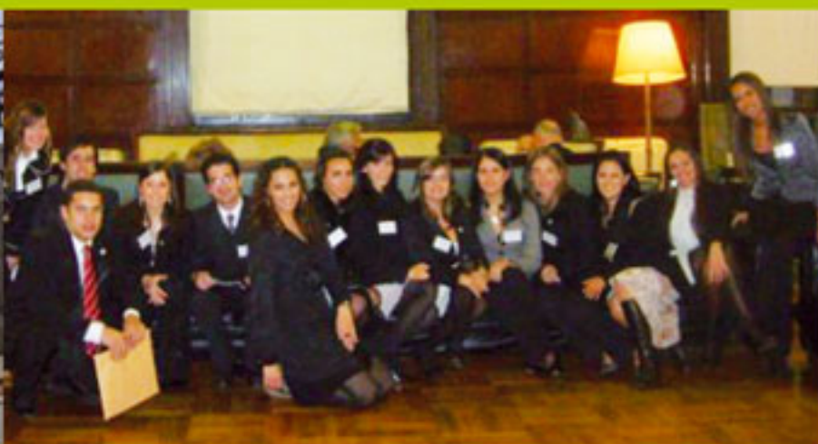
Los estudiantes de la UCA, luego de participar del concurso.

Universitarios del quinto año de la carrera de Derecho de la Universidad Católica (UCA), y de la Universidad Nacional (UNA), ambas de Asunción, se trasladaron a la sede de la Facultad de Derecho de la Universidad de Buenos Aires (UBA), para participar de la II Competencia Internacional de Arbitraje Comercial, que a partir de este año organizan conjuntamente la referida casa de estudios y la Facultad de Derecho de la Universidad del Rosario (Bogotá).