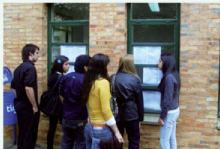
Los ingresantes observan la planilla de los resultados.

Accede a la lista completa en: www.der.una.py