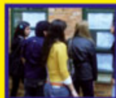
Nómina de ingresantes en Derecho UNA