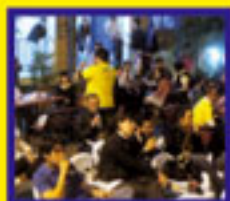
Fábrica UCA, iniciativa del CEDUC