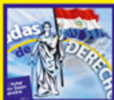
Tercera Jornada de Derecho Judicial, el 28 y 29 de octubre