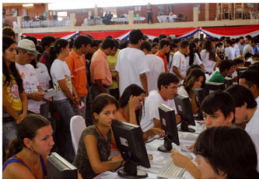
La falta de empleo es una de las problemáticas de la juventud paraguaya.

La referida Mesa cuenta con el apoyo del Programa Juventud: Capacidades y Oportunidades para la inclusión social, llevado a cabo en forma conjunta por diversas agencias del Sistema de las Naciones Unidas (OIT, PNUD, UNIFEM, UNFPA Y UNICEF).