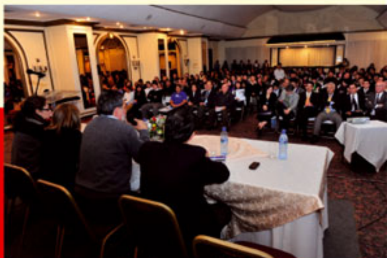
Los panelistas durante la presentación de las diferentes normativas.

Separadas las funciones jurisdiccionales de las