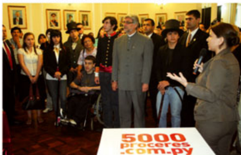
Aspecto del lanzamiento del portal Web, con la participación del Presidente Fernando Lugo.

Cuando con el equipo del Viceministerio de la Juventud realizábamos el trabajo de investigación para la campaña, nos dimos cuenta que a pesar del bajo acceso a Internet, por sobre todo en el interior del país, los jóvenes manifestaban que utilizaban este medio por diferentes motivos, ya sea para comunicarse con sus parientes en el exterior, para buscar información o estar en las redes sociales. Tomamos esa base para el diseño de esta página. También diseñamos unos materiales gráficos impresos para que los que no tienen acceso a la Web puedan expresar sus ideas por escrito y luego nosotros nos encargamos de subirlas a la Web.