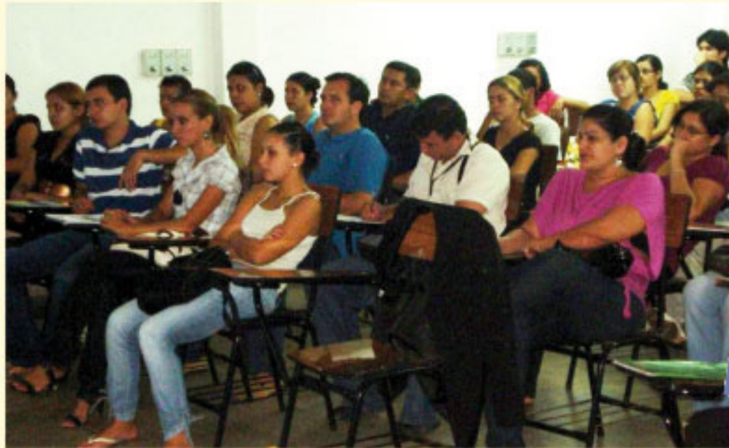
Jornada en San Pedro del Ycuamandiyú.