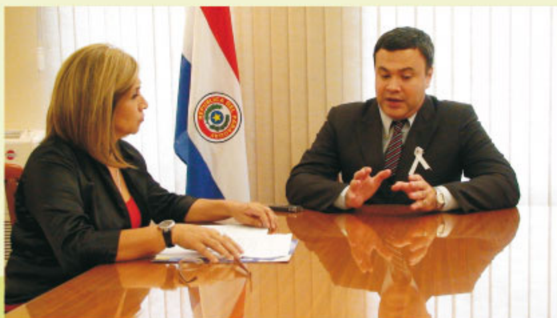
Aspecto de la entrevista que mantuvo la directora del CEJ con el ministro Blasco

Ante la pregunta de la directora del CEJ en base al conocimiento acabado de los problemas del sistema judicial mencionados por el ministro de Justicia, de la posible existencia de una hoja de ruta con destino al mejoramiento del sistema de justicia, el mismo explicó que “existe una hoja de ruta que parte de una intención de profesionalizar el Poder Judicial, para volverlo más especializado en la atención de litigios y de conflictos, a partir del análisis y aporte doctrinario e intelectual del CEJ, como hemos señalado (...) que nos permita acceder a todos los paraguayos a una justicia independiente, imparcial, eficiente y que facilite su servicio a todos los ciudadanos, sin distinción alguna”.