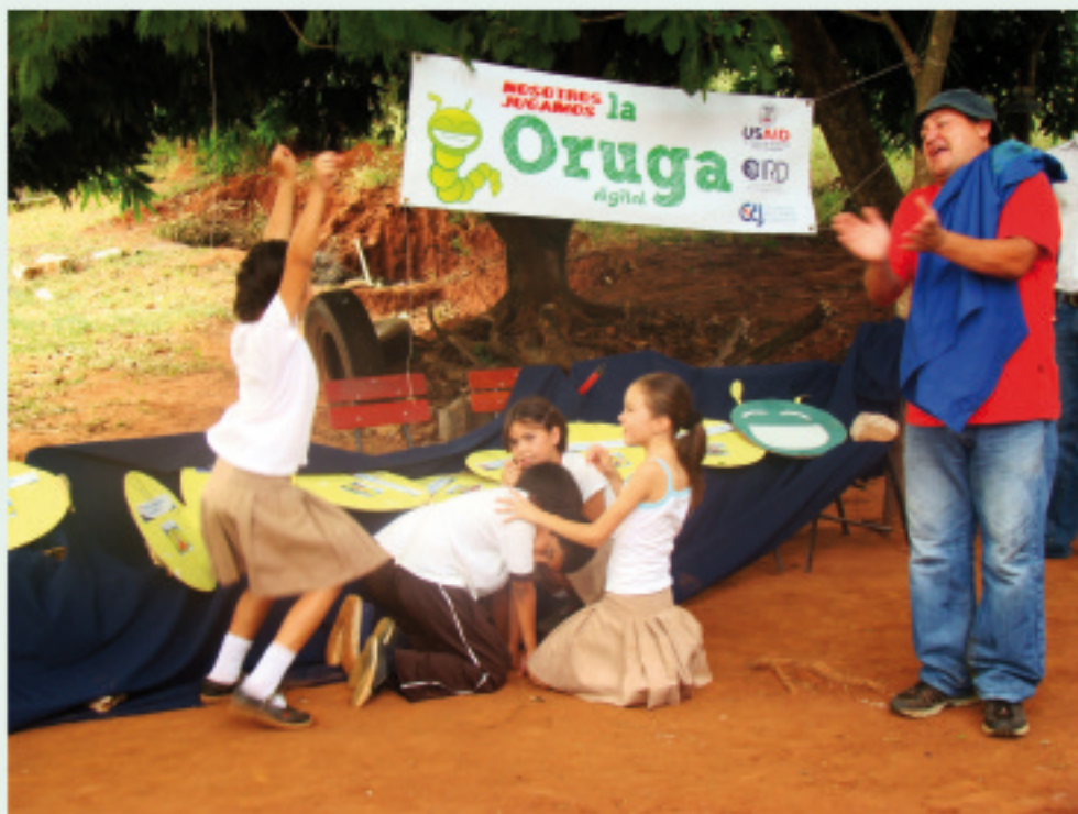
Niños/as participando en el Teatro Interactivo sobre sus derechos.