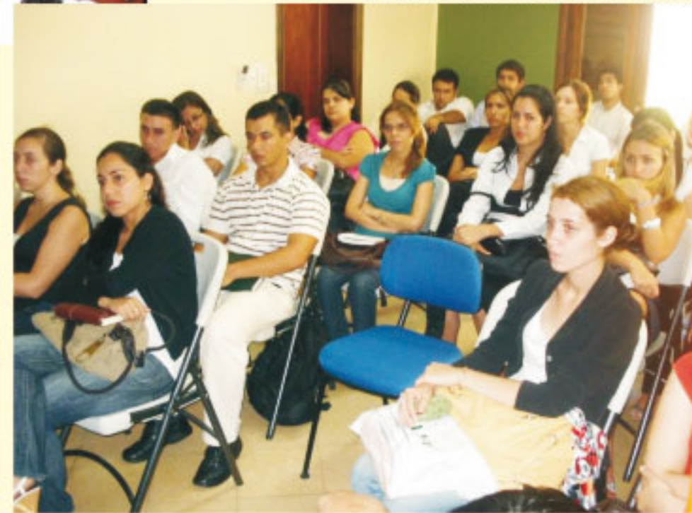
Estudiantes de Asunción.