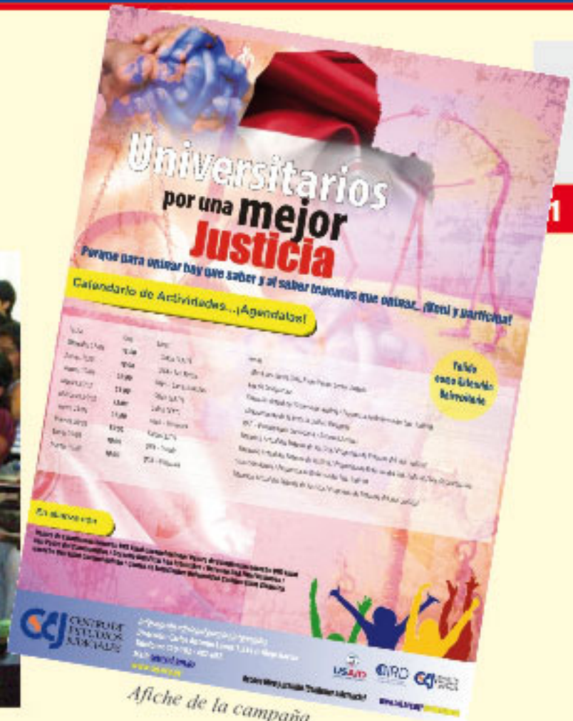
Afiche de la campaña.