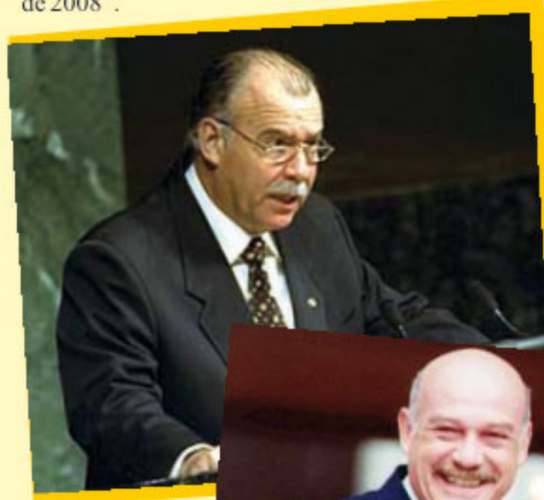
Raúl Cubas Grau.

Por su parte, el senador Blas Illano, en ocasión a la marcha de la victoria se dirigió a los opositores políticos de Lugo diciendo: "que se olviden de una vez por todas los que amenazaban con juicio político al presidente. No solamente porque no tienen los votos en el Congreso, sino porque nadie puede más que la voluntad popular expresada el 20 de abril de 2008".