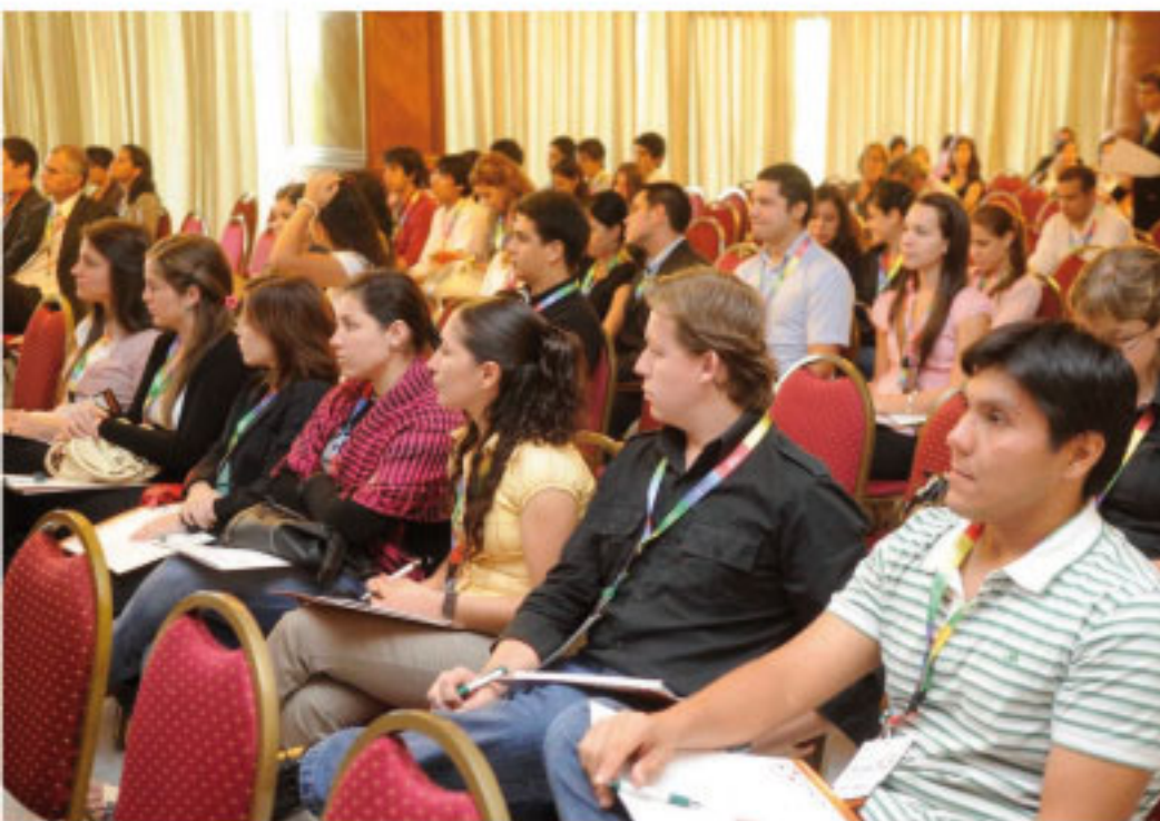
Los organizadores resaltaron que el Congreso Internacional fue un rotundo éxito.

Con el afán de crear una cultura de Congresos en el Paraguay, considerada por los organizadores como herramienta fundamental para aprender y de elemental importancia para el progreso intelectual de las personas, se desarrolló el inédito Congreso en la historia de Universidades del Paraguay, sobre los ejes temáticos “Derecho, Economía y Medio Ambiente”, que tuvo un éxito rotundo.