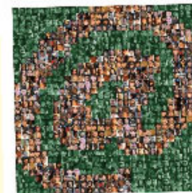
Portada de la publicación del PNUD.