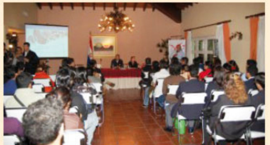
Lugo compartió la jornada con los jóvenes en Mburuvicha Róga.

organizaciones juveniles, según indicó la Viceministra de la Juventud. El proyecto es impulsado por el Viceministerio de la Juventud, a fin de impulsar el acceso de los jóvenes a un trabajo y a la educación terciaria. Otra convocatoria está prevista para el mes de junio.