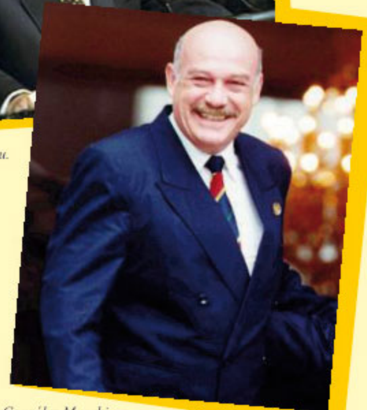
Luis González Macchi.