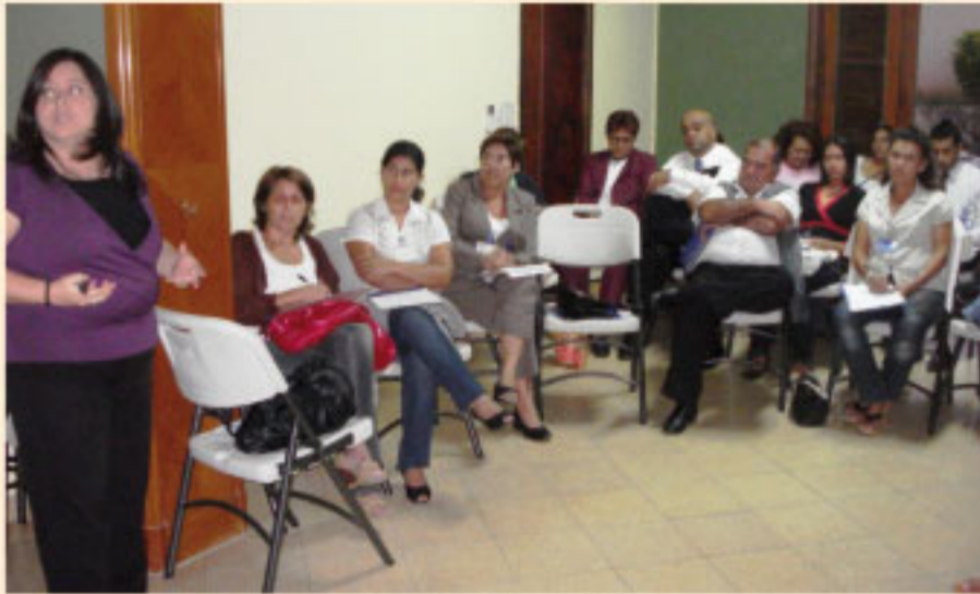
Aspecto de la reunión.

Con el objetivo de impulsar procesos de acceso a la justicia, tanto a nivel institucional como a nivel comunitario, y hacer frente a uno de los mayores problemas de la población con menos recursos económicos: la "pobreza legal", se realizó el pasado 9 de abril, la apertura de una serie de talleres que conforman el Programa de Formación de Líderes para el acceso a la justicia, organizado por el CEJ con apoyo de la Fundación AVINA.