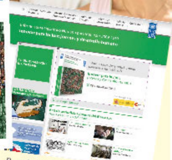
Portal Web donde se accede al informe

desempleados es un poco más alto en Paraguay que en el resto de la región: 70% de quienes no tienen empleo son jóvenes menores de 30 años.