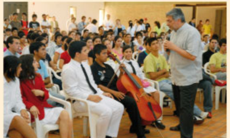
Encuentro de jóvenes con el Jefe de Estado (archivo).

El "acceso a la educación y al trabajo", también forma parte de las iniciativas, sobre todo el ingreso a la Universidad, que serán debatidas en el siguiente encuentro con las