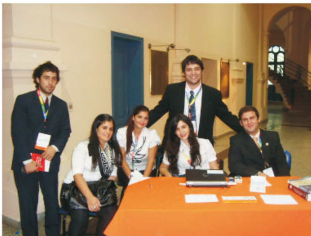
Los organizadores del evento, en plena tarea de recepción de participantes.