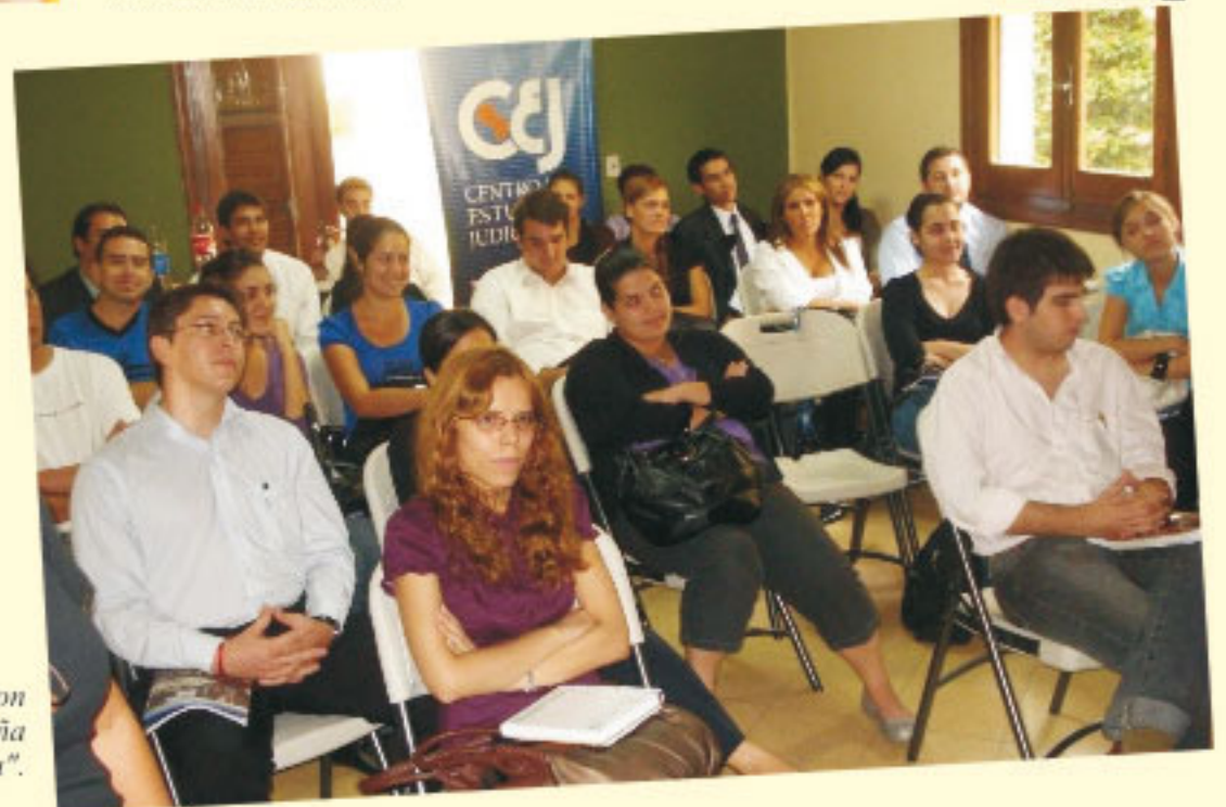
Estudiantes de Derecho de Asunción se capacitan e informan en la Campaña “Universitarios por una mejor Justicia”.

“Universitarios por una mejor justicia” se realizó en el marco del Programa Desempeño Judicial, Transparencia y Acceso a la Información, ejecutado por el Centro de Estudios Judiciales (CEJ), con el apoyo del Centro de Información y Recursos para el Desarrollo (CIRD) y el auspicio de USAID.