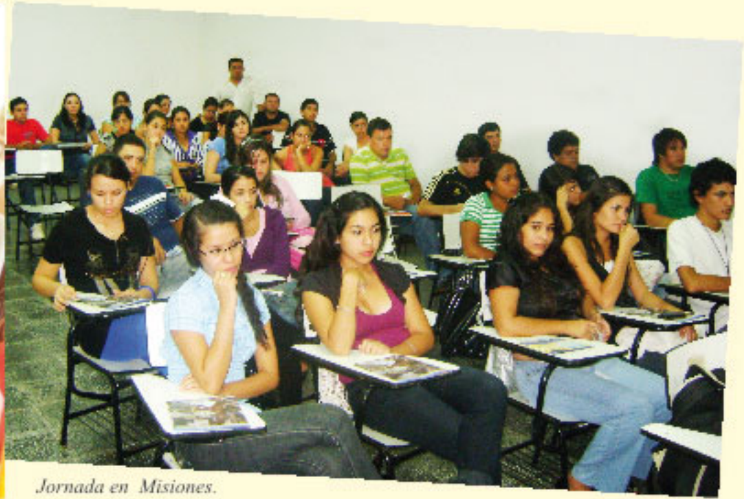
Jornada en Misiones.

de la campaña fueron: Asunción, Santaní, San Pedro, San Juan Bautista de las Misiones, Villarrica.