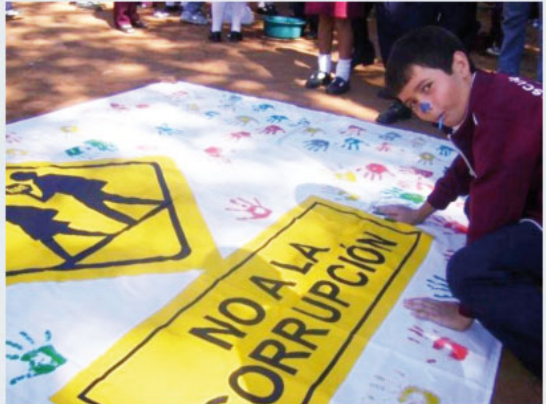
Niños aprendieron jugando durante la jornada.

Pintando y dibujando, niños y niñas del departamento de Misiones se sensibilizan y crean conciencia sobre el ejercicio del control ciudadano, así como la importancia de conocer y exigir sus derechos, y a la vez, de interiorizarse del costo social que causa la corrupción. Estos son los puntos clave de las Campañas Educativas “Exigí, Controlá, Denunciá” del Programa Costo Social de la Corrupción y Educando en Justicia, que se iniciaron en el interior del país con un gran acto de apertura, el pasado 9 de abril, en la ciudad de San Ignacio, Misiones y el 16 de abril, en la ciudad de Coronel Oviedo.