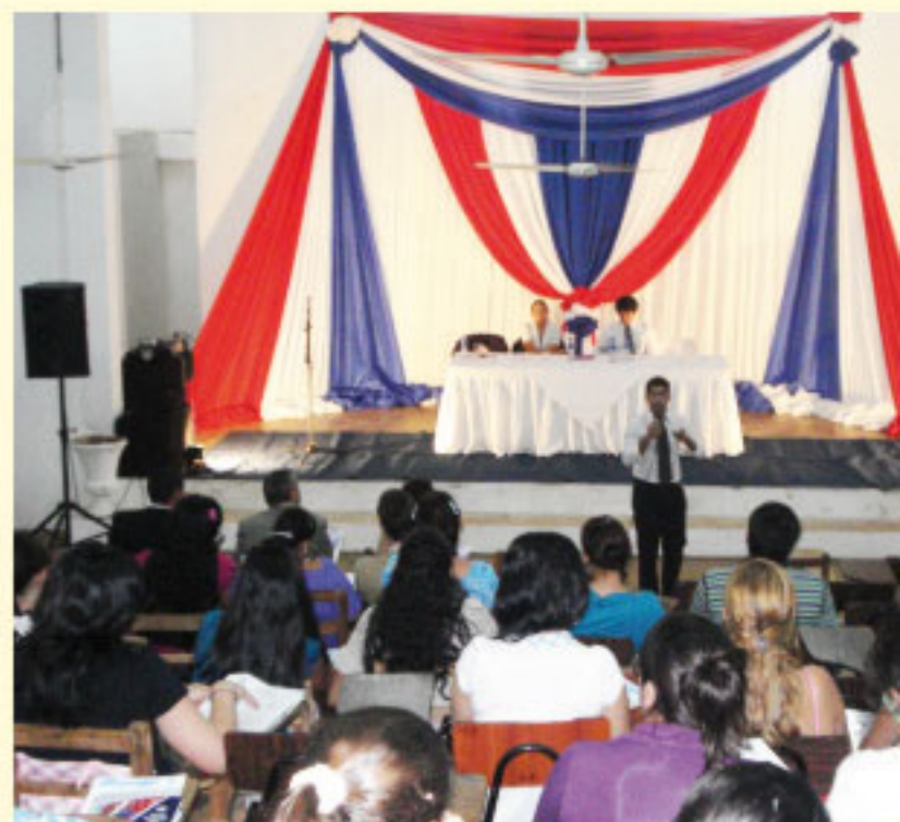
En Villarrica concluyó la campaña Universitarios por una mejor justicia

A modo de conclusión, los estudiantes manifestaron la necesidad de fortalecer la capacitación de los recursos