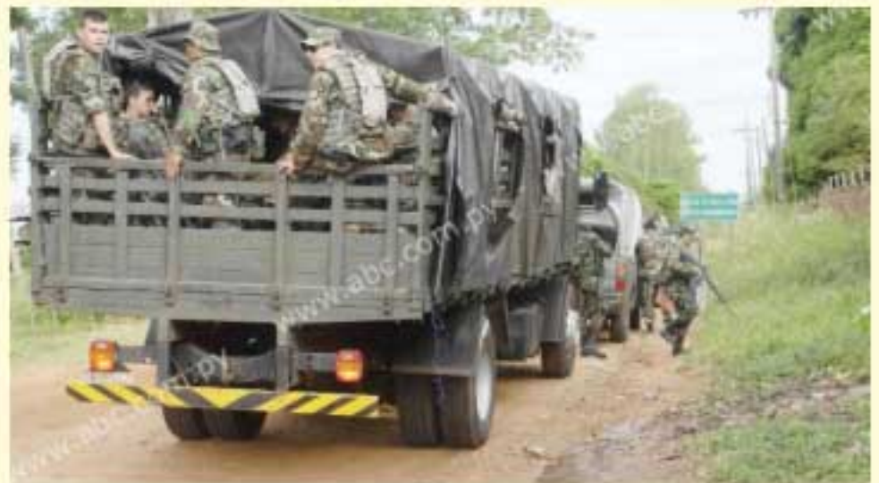
Militares realizaron incursiones en montes, en busca de miembros del EPP.

El presente artículo especifica que “en el caso de que la declaración del estatuto fuera efectuada por el