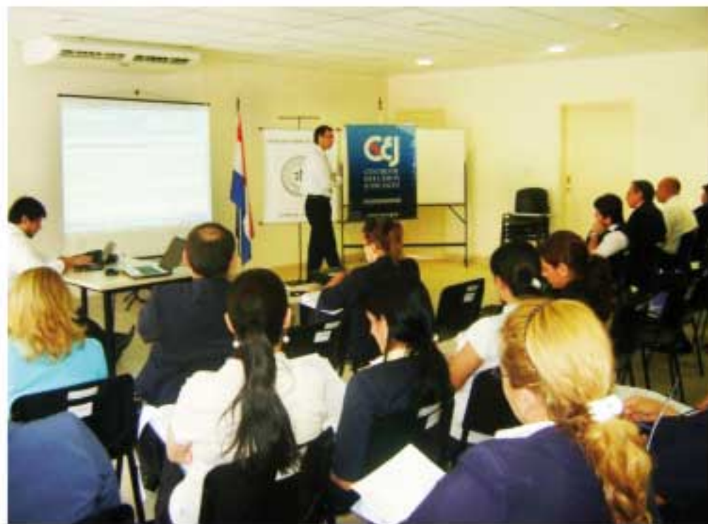
Trabajadores de la CGR se capacitaron

La corrupción es un gravísimo obstáculo para la plena vigencia de los Derechos Humanos, porque impide la concreción de derechos elementales como a la educación, a la salud, a la vivienda y el acceso a la justicia. El desvío de recursos del Estado para fines particulares “determina que los proyectos de inversión y desarrollo, y de lucha contra la pobreza, lejos de cumplir con sus objetivos agrandan cada vez más la enorme brecha entre ricos y pobres”. En ese contexto, el Fondo Regional para la Promoción de la Transparencia (FONTRA), que apoya proyectos de organizaciones de la sociedad civil de la región, seleccionó en el año 2009 el proyecto “Disminución de riesgos de corrupción en el sistema de compras, licitaciones y contrataciones del Paraguay”, del Centro de Estudios Judiciales (CEJ).