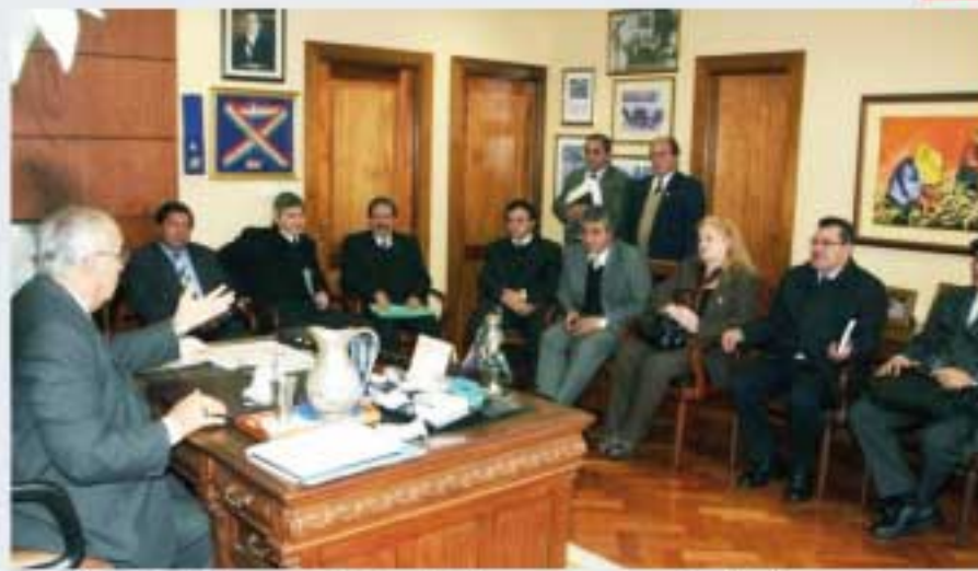
Aspecto de la reunión del ministro con representantes de gremios.

“Esta iniciativa es muy positiva considerando que es