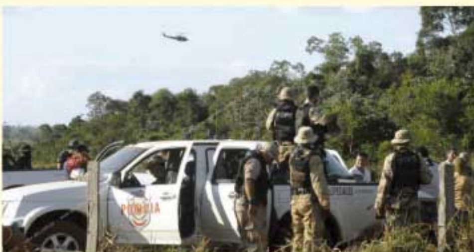
Contingente de policías en el norte del país.