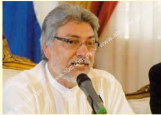
El presidente Lugo promulgó el estado de excepción en cinco departamentos.

“La experiencia histórica de Paraguay aconseja determinar concretamente cuáles son los derechos que pueden ser restringidos durante la vigencia del estado de excepción