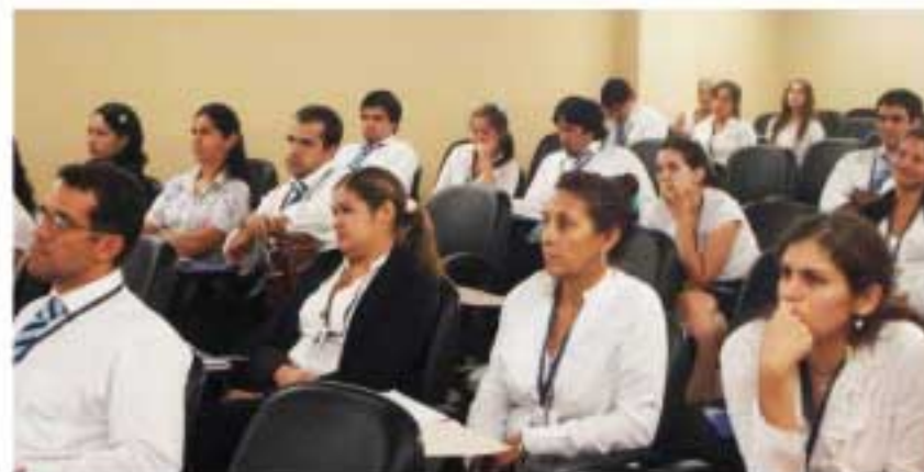
Personales de la Dirección de Contrataciones Públicas participaron del taller.