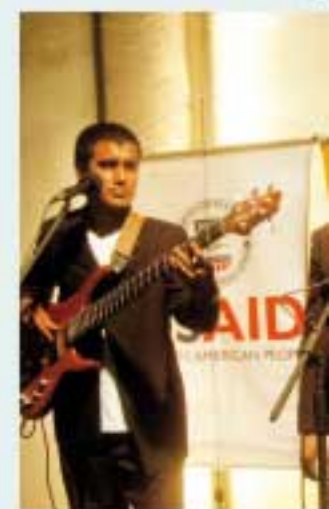
El brindis estuvo acompañado por música en vivo.