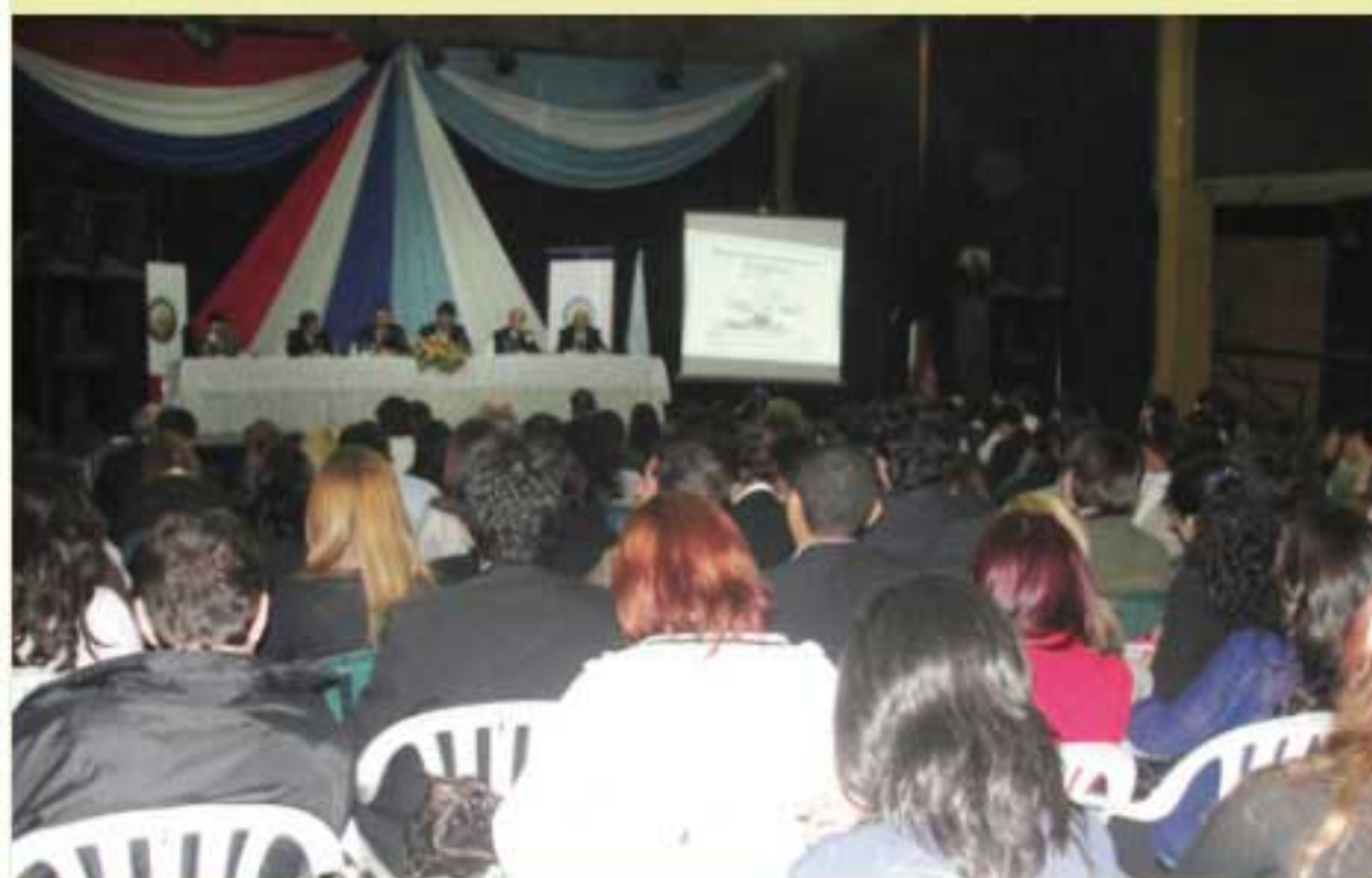
Numerosos profesionales del Derecho e interesados participaron del evento.

La garantía del acceso a la justicia es un tema central en el sistema Republicano, tanto como la necesidad de establecer Juicios por Jurados, fueron algunas de las afirmaciones vertidas durante el Seminario Internacional denominado "Constitución y Democracia", organizado por la Asociación de Magistrados Judiciales del Paraguay y el Centro de Políticas Públicas de la Universidad Católica Nuestra Señora de la Asunción. El evento fue realizado en el marco de la segunda jornada del ciclo de Conferencias Nacionales e Internacionales sobre el Fortalecimiento del Estado de Derecho.