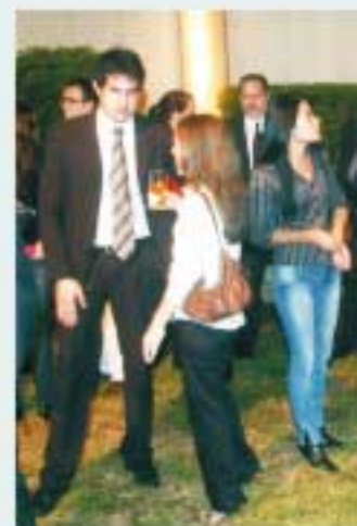
Selectos invitados participaron del evento.