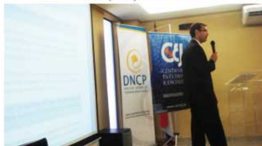
Los talleres fueron interactivos.