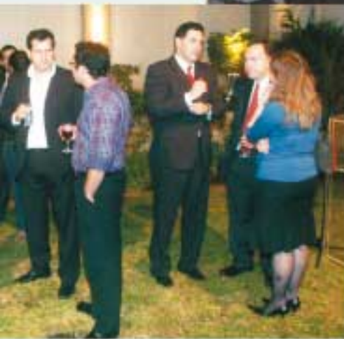
... participaron de la celebración.