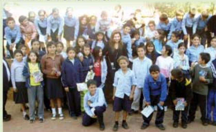
Estudiantes de Oviedo aprendieron sobre sus derechos.

Según la fuente, la campaña educativa busca contribuir con las escuelas