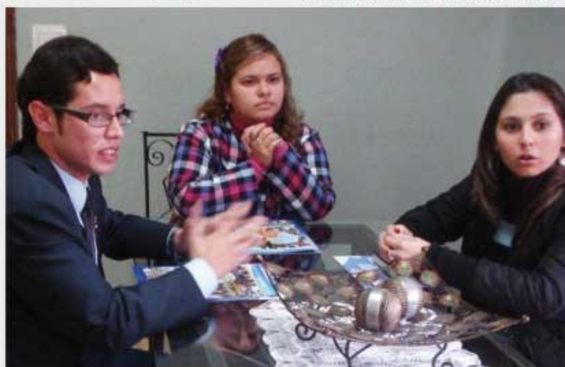
Los estudiantes de Derecho fueron asesorados para concretar un Centro independiente

cooperará con la iniciativa de forma tal a obtener como resultado final el impulso de la participación de estudiantes de la carrera de Derecho en el mejoramiento de la calidad democrática y el fortalecimiento del Estado de Derecho en Paraguay.