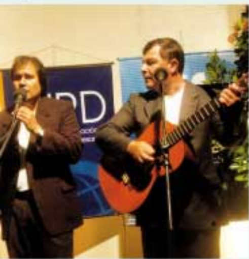
... enizado con música en vivo.