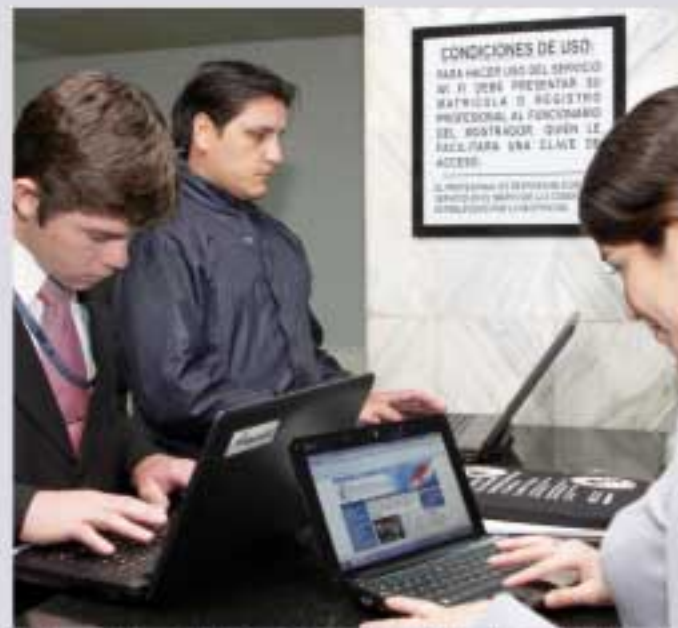
El servicio está habilitado en la planta baja del Palacio.

“Mediante el empleo de servicio, se podrá acceder al sistema informático Judisoft, en el que se informarán del estado en que se encuentran sus respectivos casos en los juzgados de la Capital o del interior. Además, podrán consultar páginas web que contengan datos de interés en materia judicial”, informa la página Web del Poder Judicial